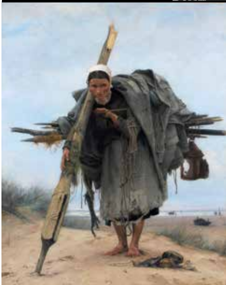
Francis Tattegrain - La ramasseuse aux épaves musée de Boulogne-sur-Mer