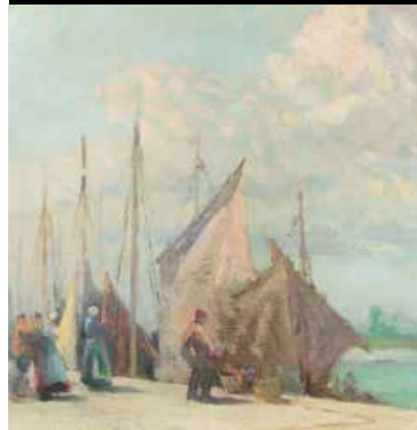
Charles Boutwood, Sur le Quai , Musée Quentovic, ville d'Étaples-sur-Mer