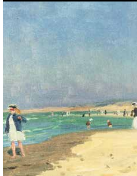
Charles Emmanuel Roussel, La plage du Touquet , Collections départementales du Pas-de-Calais