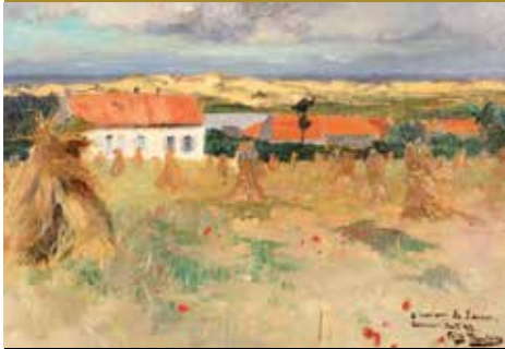
Frits THAULOW, Camiers, Maisons au bord de l'étang, 1892, huile sur toile, Musée du Touquet-Paris-Plage