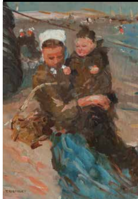
Eugène Flavien Trigoulet (Paris, 1864- Berck-sur-Mer, 1910) Matelote à l'enfant Coll. Musée Opale-Sud, Berck-sur-Mer