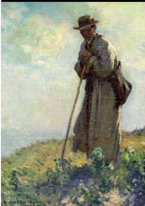
Van der Weyden Harry, Berger dans la dune , huile sur carton, collection musée de France Roger Rodière